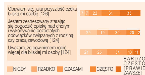
Ryc. 4 Uczucia opiekunów związane z opieką nad osobą chorą na TNP (wyniki podane w %)

Pytanie 3 w Poradniku dla Opiekuna na stronie 20 ma za zadanie pomóc Ci określić uczucia oraz zachęcić do rozmowy na takie tematy z pracownikami służby zdrowia, organizacjami zrzeszającymi pacjentów jak i Twoimi najbliższymi.