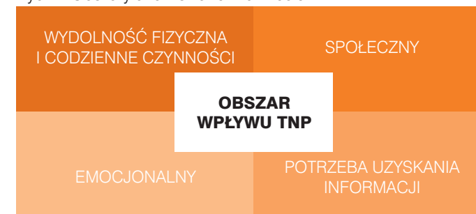
Ryc. 1: Obszary analizowane w ankiecie

Międzynarodowa ankieta została przeprowadzona w 2011 roku i miała na celu poszerzenie wiedzy na temat wpływu TNP na życie pacjentów i ich opiekunów, w obszarach innych niż fizyczne objawy choroby. Jak pokazano na Ryc. 1, badanie ankietowe analizuje cztery podstawowe obszary, z których kluczowe wyniki zostały przedstawione na kolejnych stronach Poradnika.